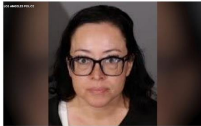
La police de Los Angeles a publié la photo de l'enseignante qui a été placée en détention.

Brigitte Macron ! J'ai toujours entendu dire que c'était des fakes news !! Donc si c'est des fakes pourquoi l'arrêter ?