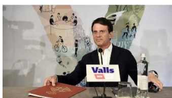
Manuel Valls lors d'une conférence de presse dans le cadre de la campagne pour l'élection municipale de Barcelone (Espagne), le 29 mai 2019.

connaît rien à l'Éducation nationale et à la recherche 35 ! Les ministres de la santé depuis 2017 : Agnès Buzyn (jusqu'en 2020) ; Olivier Véran ; Brigitte Bourguignon ; François Braun ; Aurélien Rousseau ; Agnès Firmin-Le Bodo ; Catherine Vautrin ; Geneviève Darrieussecq ; Catherine Vautrin (à nouveau). Soit 9 ministres au total. Plus quatre Premiers Ministres, le régime Macron, c'est l'instabilité pire que la IVème république. Manuel Vals se fait insulter dès sa première prestation sur France Inter 36 . La personne qui nous a annoncé le gouvernement du radeau de la méduse est mise en examen pour prise illégale d'intérêts 37 . J'ai été renommée ministre après avoir parjuré devant une commission d'enquête parlementaire, je suis...? Aurore Bergé.