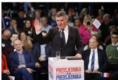
Le résultat, si les sondages se confirment, pourrait bien être la continuation d'une division au sommet du pays, avec la réélection de Zoran Milanović à la présidence.

décision de dissoudre n'a pas toujours été comprise. "Les Français sont capables de lui pardonner", se persuade un proche.