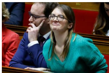
Manuel Valls condamné à payer 277 000 euros pour financement illicite de sa campagne lors des municipales de Barcelone en 2019