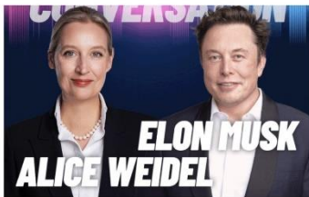
Politique La Commission européenne menace Musk avant son entretien avec le leader de l'AFD

§182 Le plus grand voleur de tous les temps. À raison, Elon Musk affirme que le président ukrainien, Zelensky, est le « champion de tous les temps » pour avoir réussi les plus grands vols d'argent de l'histoire auprès des contribuables américains. Je rajouterai : des contribuables européens également 52 . Il faut voir où passe l'argent et le nombre de résidences de luxe et de Rolls-Royes des élites ukrainiennes.