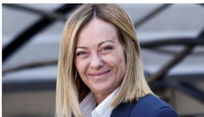
Giorgia Meloni (48) s'entend bien avec Trump : va-t-elle désormais prendre la tête des négociations avec Washington ?

quelques passages succulents de l'article : Meloni avait proposé très tôt de servir de médiateur entre l'Europe et les États-Unis. Cela est nécessaire car la Commission européenne sous la direction d'Ursula von der Leyen n'a pas encore réussi à convaincre Trump – il a rejeté sa proposition de lever les droits de douane sur les produits industriels. La mission de Meloni : la suppression des droits de douane de 20 % sur presque tout (le bois de l'UE est exclu, entre autres) ou, comme objectif minimum, leur réduction de moitié à 10 %. Au total, selon les calculs des responsables de l'UE, les États-Unis